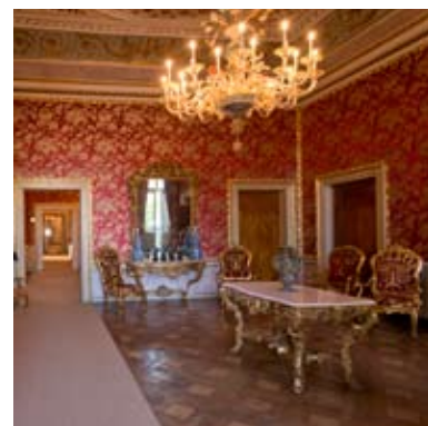
Sala delle Udienze

Risalgono probabilmente alla fine del secolo XVIII, il soffitto è decorato con campiture in stucco a delicati colori e il fascione perimetrale a