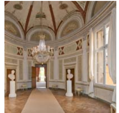
Sala dei Pranzi giornalieri