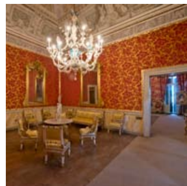
Sala del Trono Lombardo-Veneto

La tappezzeria in rosso e oro (Rubelli – Venezia) riproduce fedelmente quella – probabilmente francese – qui posta in opera nel 1854 e conservata sotto l'attuale. Gli eleganti mobili Impero sono originali. Il grande lampadario in vetro con fiori policromi è muranese del secolo XVIII.