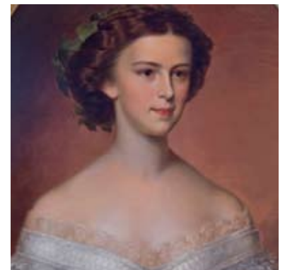
Ritratto dell'Imperatrice Sissi