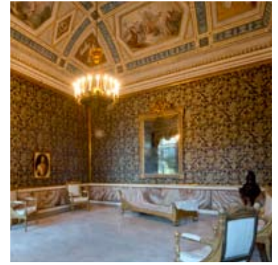
Camera da letto dell'Imperatrice

Tra le finestre vi è la pala già sull'altare della Cappella di Palazzo, La Trinità , notevole opera di Carletto Caliari, figlio del celebre Paolo Veronese, dipinta in origine per una chiesa di Belluno e requisita in età napoleonica. Nella sala sono presenti anche opere di Georg Martin Raab (Vienna 1821 - 1885), datate 1874, che ritraggono l'Imperatore Francesco Giuseppe e l'Imperatrice Elisabetta (prestati a lungo termine del Belvedere di Vienna).