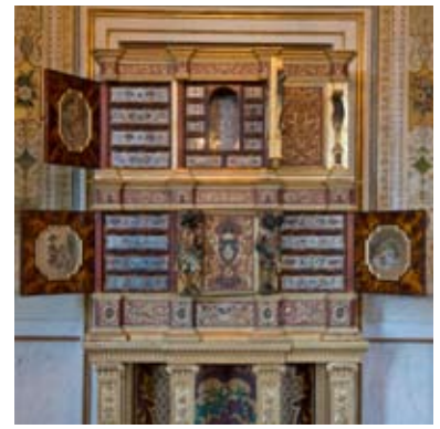
Stanza da Studio dell'Imperatrice

Il lampadario 'a campana', con cristalli molati di Boemia, è del primo Ottocento.